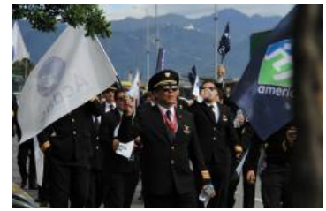
Así será la paulatina recuperación en Avianca tras paro de pilotos

Esa instancia, anota, es la Superintendencia de Transporte, pero debe clarificarse su papel frente a un paro.