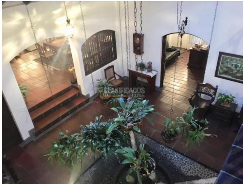
Casas , Venta , Tejares Cristales