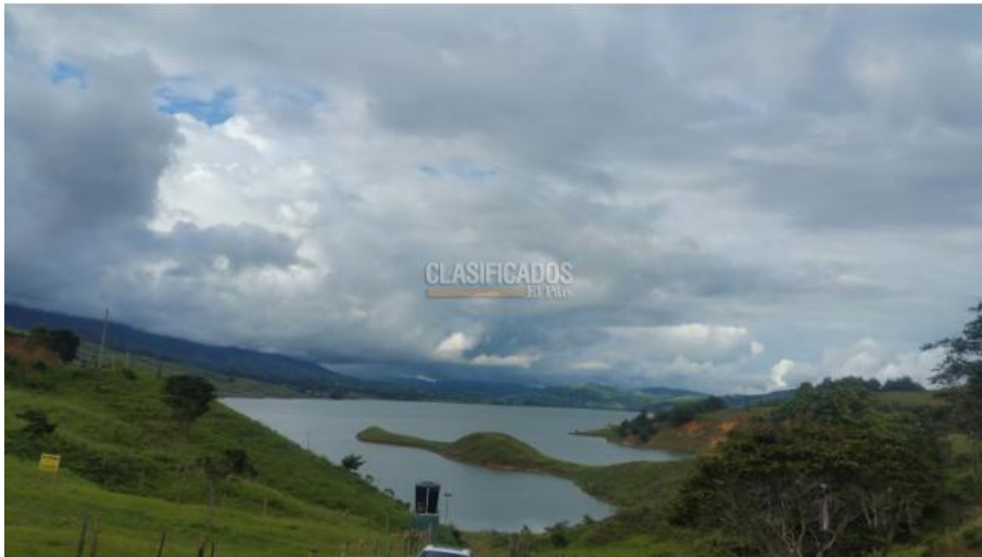
Lotes , Venta , Calima (Darién)