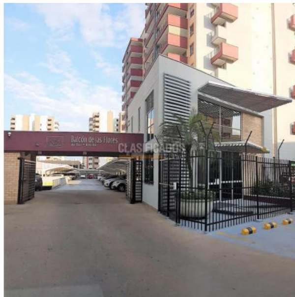
Apartamentos , Venta , La Flora